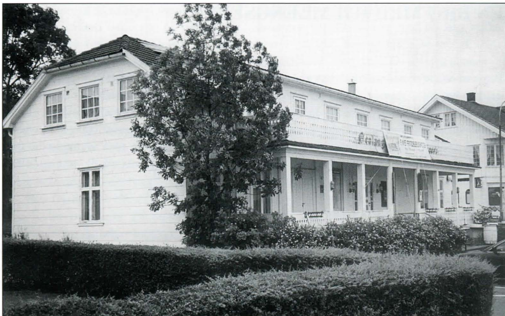
Sommeren år 2000. Gjestgiveriet ligger fremdeles som en fondvegg vendt mot havnen. Nevlunghavns adkomst!

Ytterst på Brunlanes i Larvik kommune finnes en gammel og pittoresk fisker og loshavn med trange gater som bukker seg mellom store knauser og hvitmalte gamle hus. Ned mot en inne-lukket havn vider torget ferdsselsåren ut mot sjø og båter. Torget er omkranset av fiskemottak, en gammel rekefabrikkbygning samt to gamle gjestgiverier. Det ene er i dag bolighus, det andre står tomt og vitner om nylig avsluttet gjestgiverivirkosomhet. Tomheten er påfallende ettersom bygningen inntar rådhusets plass på torget. Utstyrt med Nevlunghavnsk nøktern småstedbeskjedenhet er den plassert som et italiensk palazzo som torgets fondvegg. Stor