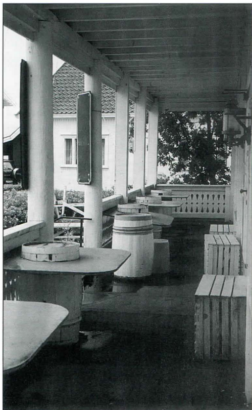
Tomt og øde. Aldri mer en øl på verandaen? Forfallet setter inn.

del av vår kulturarv og identitet og som ledd i en helhetlig miljø- og res-sursforvaltning. Det er et nasjonalt ansvar å ivareta disse ressurs-er som vitenskapelig kildemateriale og som varig grunnlag for nålevende og fremtidige generasjoners opplevelse, selvforståelse, trivsel og virksomhet. Med kulturminner menes alle spor etter menneskelig virksomhet i vårt fysiske miljø, herunder lokaliteter det knytter seg historiske hendelser, tro eller tradisjon til."